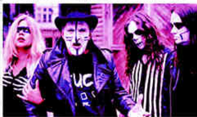
Shamrock et plus de 100 autres artistes se réunissent à Troyes.

FEMMES La convention de rock metal revient après deux ans de silence mortel. Cette édition tombe en même temps que les 30 ans de l'association organisatrice.