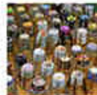
Le Mondial de la capsule à Troyes.

Le Mondial de la capsule revient le 6 mars à Troyes. Cette édition est organisée par l'association Les Femmes de Rock.