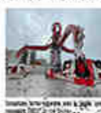
Les Foires de mars à Troyes.

Après une absence de plusieurs années, les Foires de mars reviennent à Troyes. Elles auront lieu du 27 au 29 juin au Parc de la Vallée de la Seine.