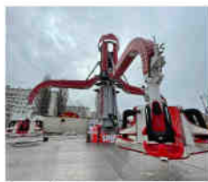
Sensations fortes assurées avec la Spider, une nouveauté 2022. Jérôme Urley

Parmi les attractions à ne pas manquer : l'Usine, montée pour la première fois sur un champ de foire.