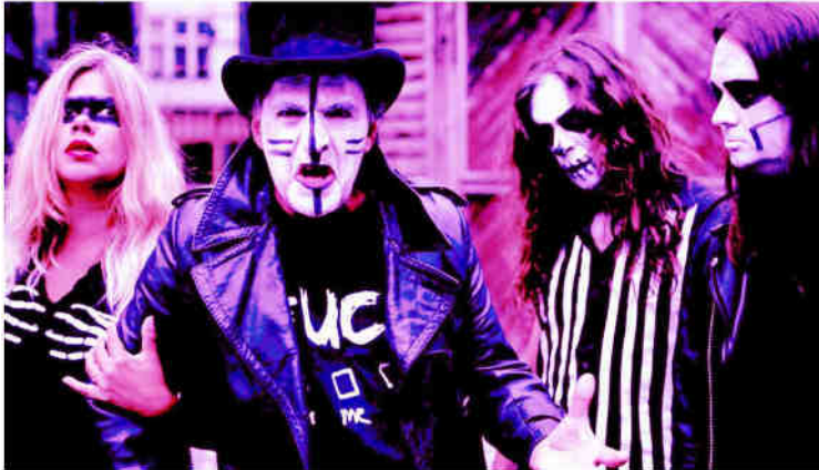
Sleazyz est un groupe de rock punk metal influencé par les vieux films d'horreur... (Sorjico)

FISMES La convention de rock metal revient après deux ans de silence mortel. Cette édition tombe en même temps que les 30 ans de l'association organisatrice.