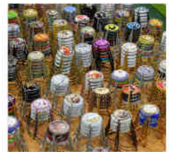
Les dernières éditions avant la pandémie ont attiré entre 5 000 et 6 000 visiteurs.

Tout au long de la journée, des animations seront proposées : la tonnelerie de Champagne fera des démonstrations de fabrication de tonneaux et